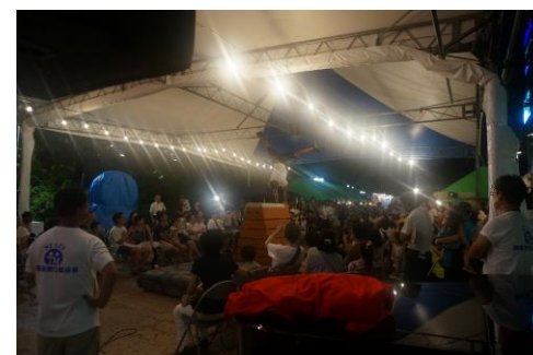
モンスターボックス 19段