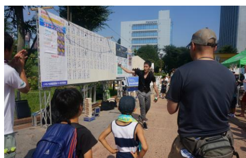
大道芸と花台 (三菱・三井・野村)