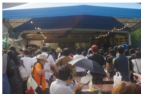
奥華子ライブに集まったお客様