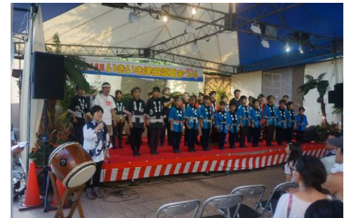
そでっ鼓連のみなさん