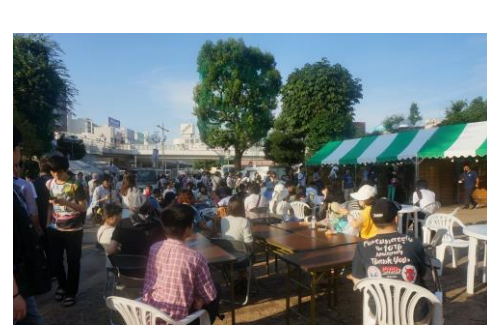
まつり会場の様子