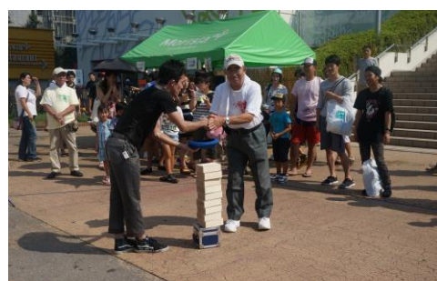
大道芸 (高橋会長から¥¥¥???! ☆)