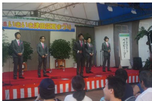
ボーカルグループ ベイビー・ブー