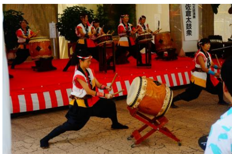
佐倉太鼓衆の演奏