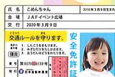
子ども安全免許証