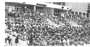
スタンドはアクアグリーン一色に染まりました

できる準備は限られています。削ぐべき部分は削ぎ、研げる部分を研ぎ澄まして、次のステージに臨みます。今シーズン、まだまだよろしく願います。」