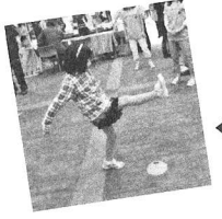
▲決起会の前には体験コーナーを実施