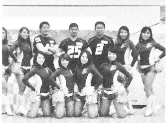
▲チアリーダーも参加し、パフォーマンスしました